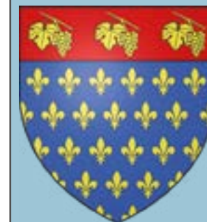
Blason de la ville

Après la Première Guerre mondiale, les terres cultivables sont progressivement utilisées pour la construction, et la population de la ville augmente rapidement. L'ère industrielle commence avec des entreprises telles que les sablières Morillon-Corvol et les Chantiers de la Haute-Seine, attirant une importante population ouvrière, en grande partie d'origine bretonne. La dernière grande phase de peuplement a lieu dans les années 1950 et 1960.