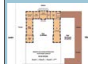
Plan du château 2017